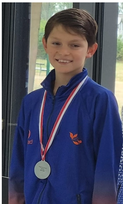
Podium imposées & Solos garçons 2011